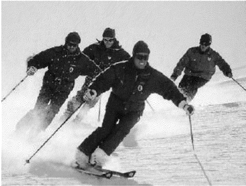
Le nevi valdostane saranno teatro dei primi Mondiali militari di sport invernali