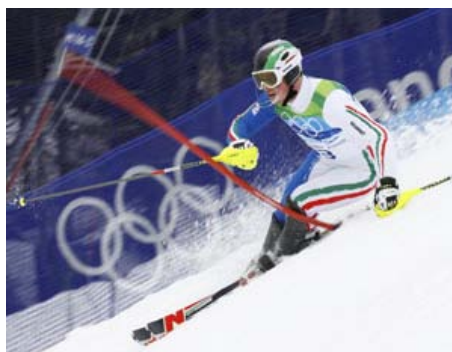
Giuliano Razzoli durante la discesa olimpica

Da sabato 42 Paesi saranno impegnati nelle discipline invernali. Tra le stelle anche l'olimpionico Giuliano Razzoli